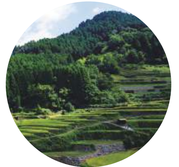
福岡県うきは市 棚田百選つづら棚田